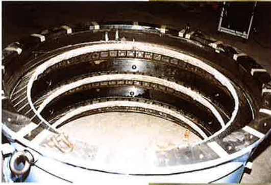
ウレコンシールの 取付け状況