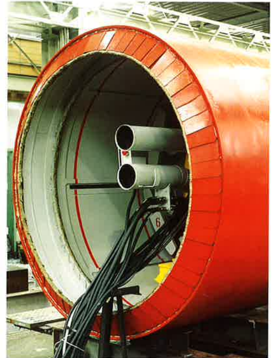
シールド機に取付けられたウレコンシール